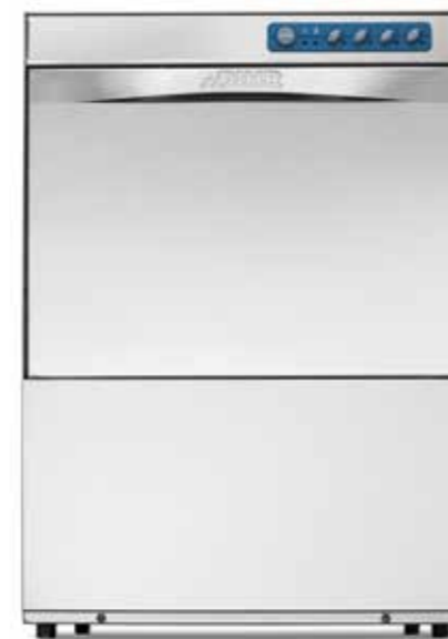
GS 50 ECO