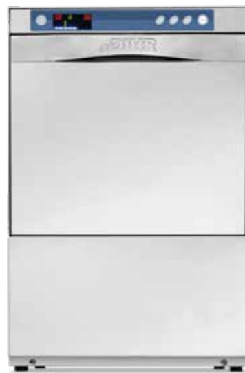
GS 40 - GS 40T