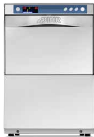
GS 35 - GS 35T